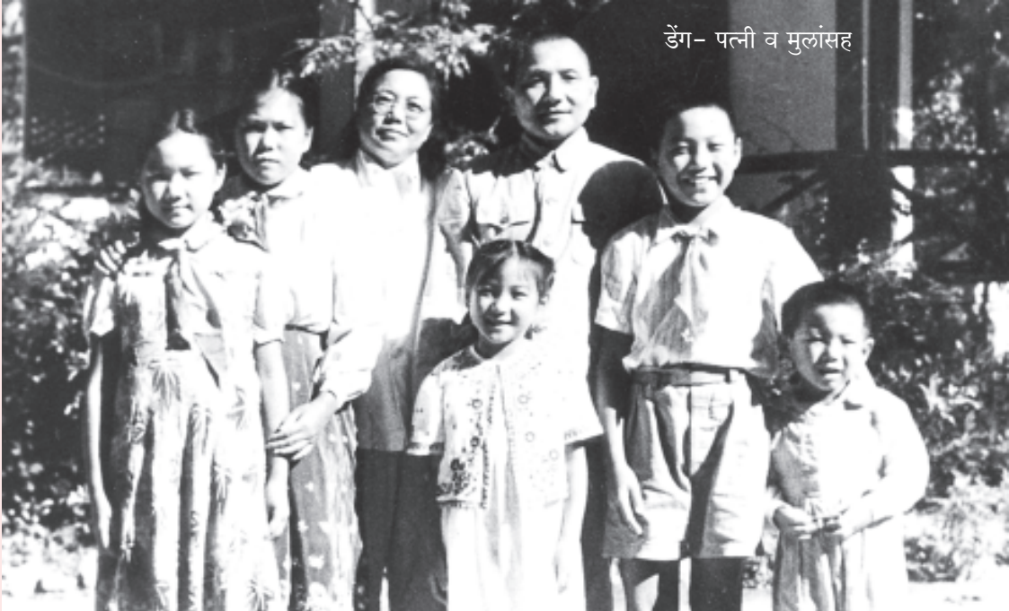
डेंग- पत्नी व मुलांसह