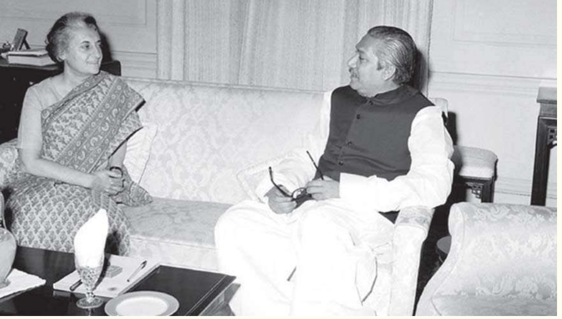
इंदिरा गांधी आणि शेख मुजिब रेहमान