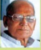
लोकनायक जयप्रकाश नारायण