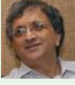
कालपरवा रामचंद्र गुहा